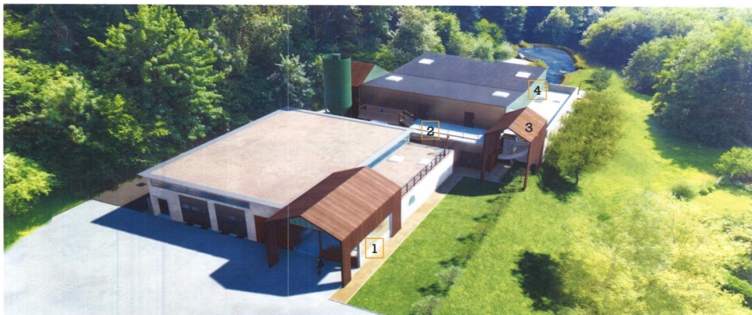
1. Le premier pavillon marque l'entrée 2.. Le recul par rapport au bâtiment existant permet de cacher les ouvrages disparates 3... Le Hall en bois protège l'escalier de distribution des terrasses 4. ... L'étage en polycarbonate et la toiture 'plate' cherche à faire disparaître l'architecture dans ce paysage de colline boisée.

Ce nouveau bâtiment intégrera une unité de décarbonatation ainsi qu'une unité de traitement des pesticides et ultérieurement une unité de traitement des nitrates ; l'architecture s'intégrant dans l'environnement et étant validée par l'Architecte des Bâtiments de France. Une clôture neuve de type treillis soudé rigide plastifié gris sera installée.